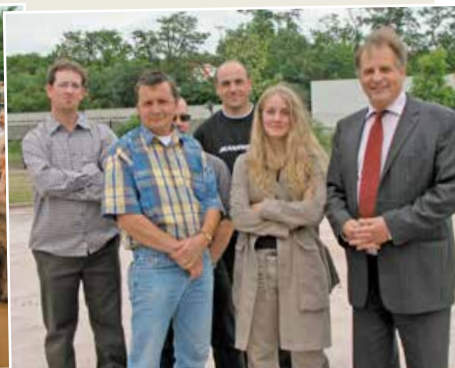
La toute première équipe chargée de l'aménagement du nouvel espace ainsi créé.